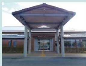
発達支援センター

お子さまの発達障がいに関することや、成長、発達、学習の課題、友だちとの関係、コミュニケーション、心の問題など発達に関して専門スタッフが相談を受け付けています。