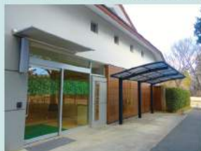
エール（適応指導教室）

何らかの理由で学校に行けない宗像市立小中学校児童生徒のための教室です。様々な体験を通して自立を促し、学校生活や社会生活に適應できるよう援助・支援を行っています。