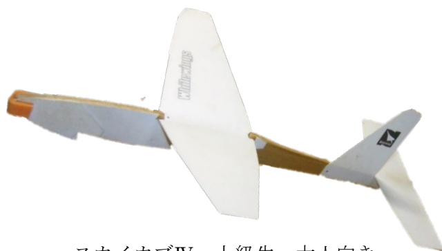
スカイカブⅣ・上級生～大人向き